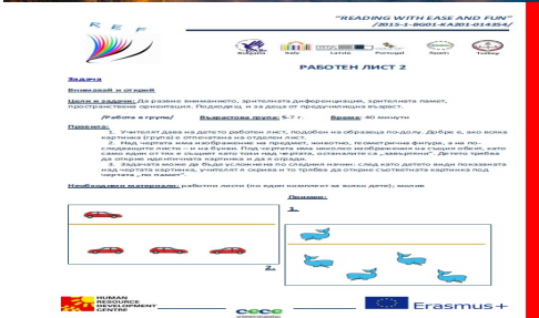
Итали, Еуропа, Дубровник, 05.06.2017, 09:00, Дубровник, работилница за работа с четива