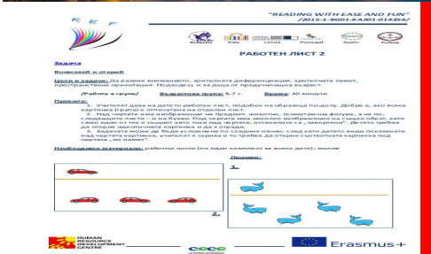
Работен лист за деца, разработен в рамките на програмата Erasmus+.