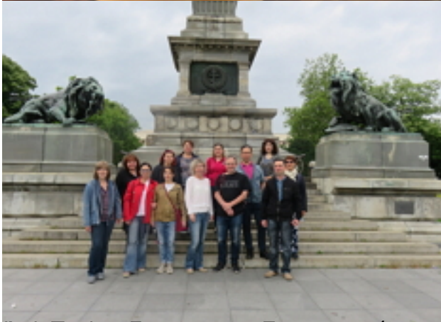
Итали, Еуропа, Дубровник, 05.06.2017, 09:00, Дубровник, работилница за работа с четива