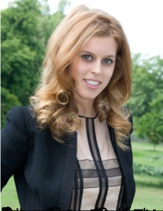
Изображение на Беатрис